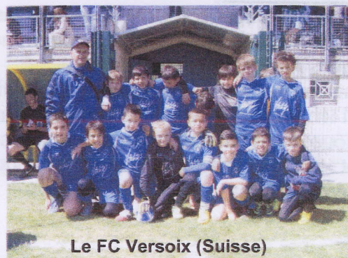
Le FC Versoix (Suisse)

Reportage complet sur notre site internet: