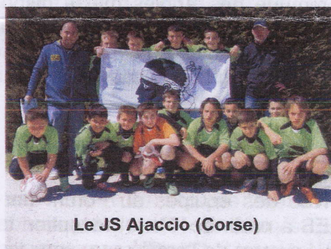
Le JS Ajaccio (Corse)