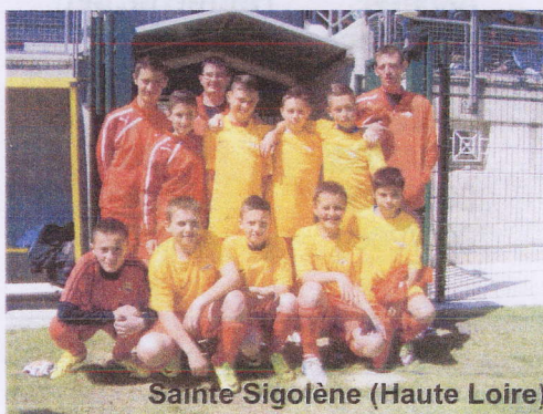
Sainte Sigolène (Haute Loire)