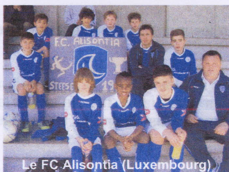
Le FC Alisontia (Luxembourg)