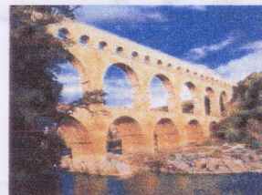
Le pont du Gard