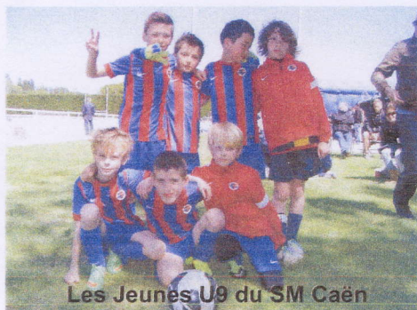
Les Jeunes U9 du SM Caën